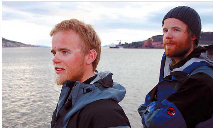
I NARVIK: Turgåerne har trivdes godt i Narvik og har spart opp mye energi til turen videre.

TOMMY JENSEN tommyje@fremover.no Tlf 76 95 00 00